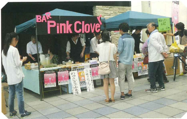
ピンククローバーの出店

今回は、この「ピンククローバー」のほか、おつまみとして「わかさぎの南蛮漬」やオードブル各種、「れんげ蜂蜜」、「長良産のぶどう酒」、さらには生ビールなども販売して、大変な盛況となりました。