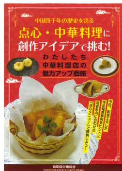
点心・中華料理に創作アイデアで挑む!

内容としては、特に調理学校の生徒、食物関係の高等学校の生徒等若い人から、コンテストを通して応募のあった、若年層に好まれそうな新しいレシピと、組合員店舗からの新作事例などもとり入れて、「点心創作メニューのアイデアレシピ集」を作成します。これを組合員に配布し、各店舗において既存メニューに新しいレシピを追加して、更なる客層を引き込む等、活性化の支援を行っていきます。