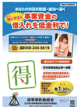
融資制度早わかり冊子

この内容は、設備資金や運転資金の借り入れについて、飲食業に絞った融資制度(衛経貸付)のガイドブック(早わかり冊子)を作成し、組合員がより利用しやすい制度の普及を図ることです。この冊子は、具体的かつわかりやすいことを基本に、飲食業の現場に立った具体例の記述など、すぐに利用できることを目指しています。この冊子が、各組合職員の経営指導を助け、また融資のメリットを享受できることで、組合加入を促進するよう期待しております。