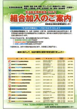
全国指導センター作成ちらし