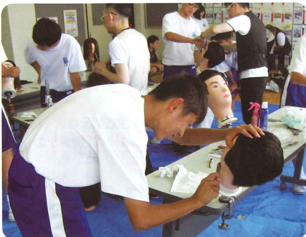
シェービングの実習

これを機会として、今後多くの若者たちが生衛業に一層興味を持ち、そして、より多くの若者がこの業界に新たに参加するなど、生衛業界がより活性化し発展するよう期待するところです。