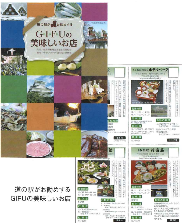
道の駅がお勧めする GIFUの美味しいお店